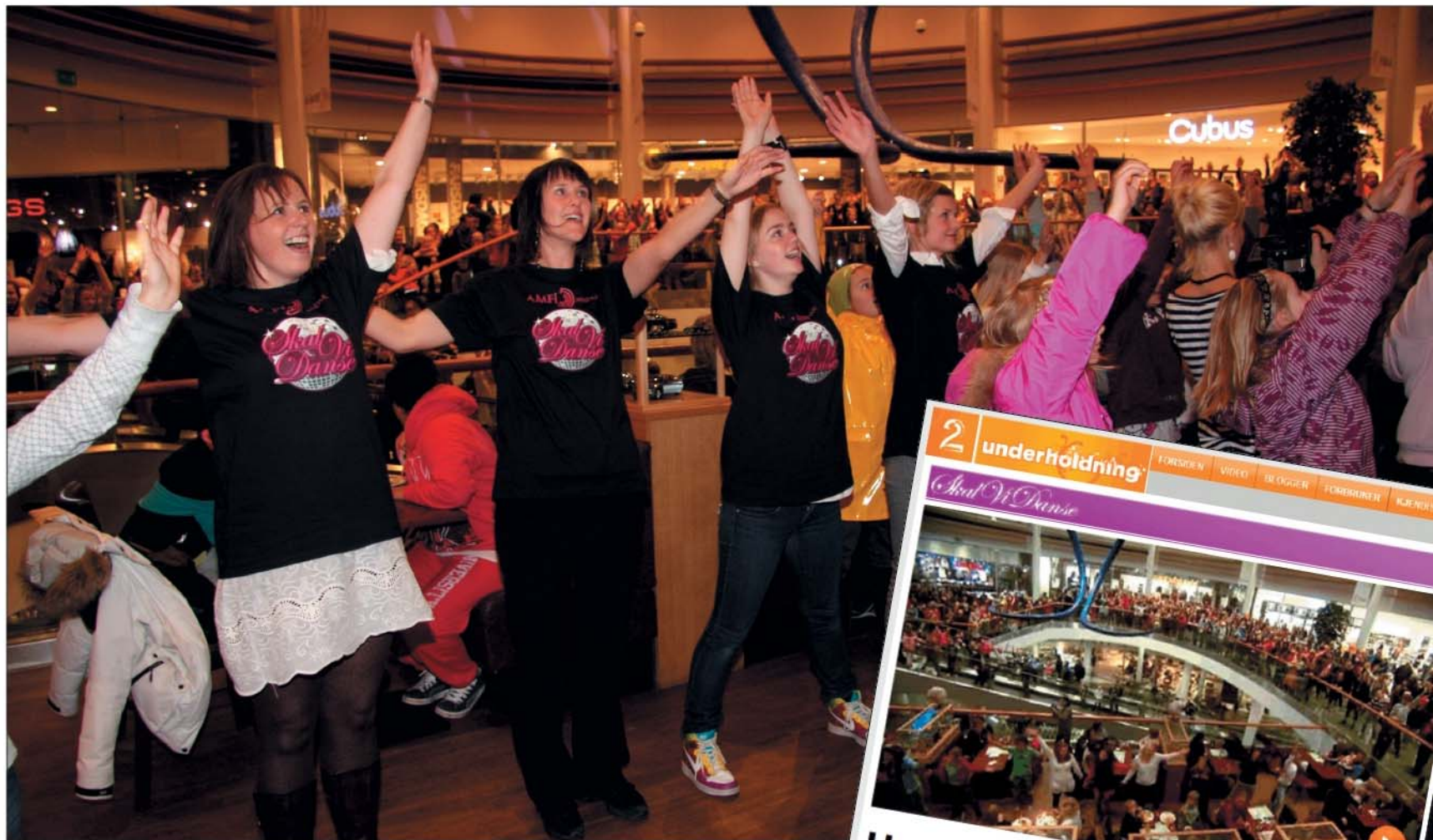
Mange hundre danseglade kunder var i ilden under spontandansen på AMFI Madla.